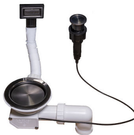
Vidange automatique Space Push Gun Metal - PO